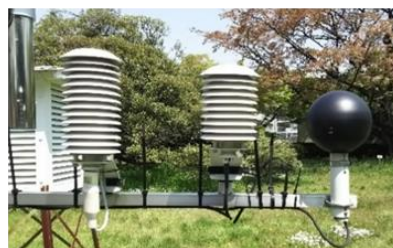
暑さ指数(WBGT)測定装置

暑さ指数を用いた指針としては、(公財)日本スポーツ協会(元日本体育協会)による「熱中症予防運動指針」、日本生気象学会による「日常生活における熱中症予防指針」があります。